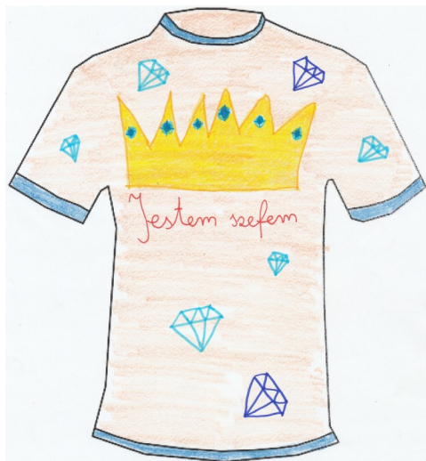
DLA PANI DYREKTOR

Z okazji Dnia Nauczyciela zaprojektowaliśmy wyjątkową kolekcję koszulek dla naszych kochanych belfrów!